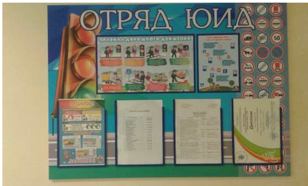
Уголок отряда ЮИД