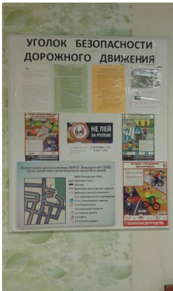
Стенд по безопасности дорожного движения

Краткая характеристика педагога-руководителя отряда ЮИД